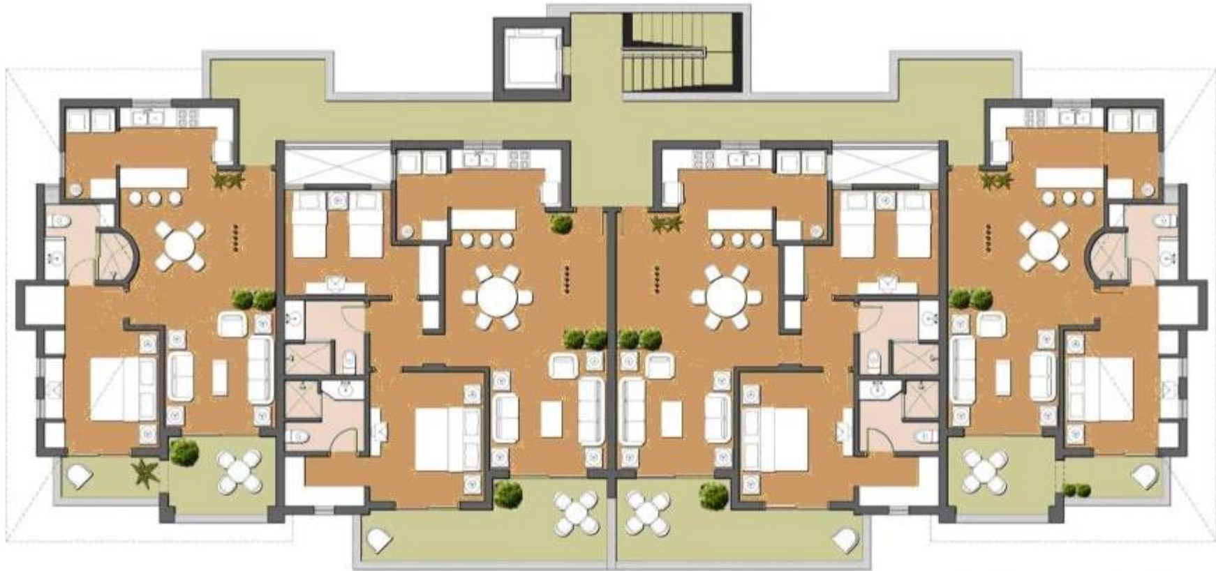
1 y 2 Bedroom Condos 5 stories (5th. floor)

Baja Investment Properties PO Box 212013 Chula Vista, CA. 91921 Ph 619 623 5600 Fax 619 872 0684