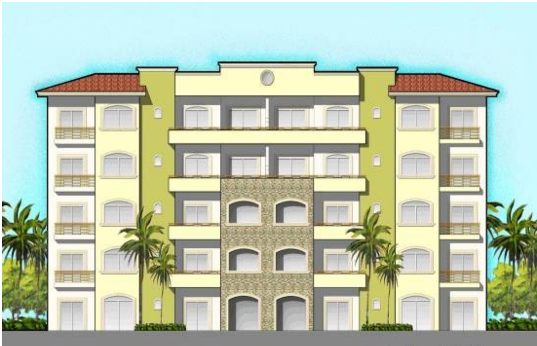
5 Stories Building

Baja Investment Properties PO Box 212013 Chula Vista, CA. 91921 Ph 619 623 5600 Fax 619 872 0684