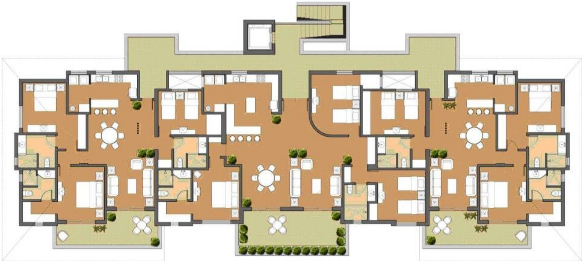
2 AND 3 BEDROOM CONDOS BUILDING 5 AND 6 STORIES

Baja Investment Properties PO Box 212013 Chula Vista, CA. 91921 Ph 619 623 5600 Fax 619 872 0684